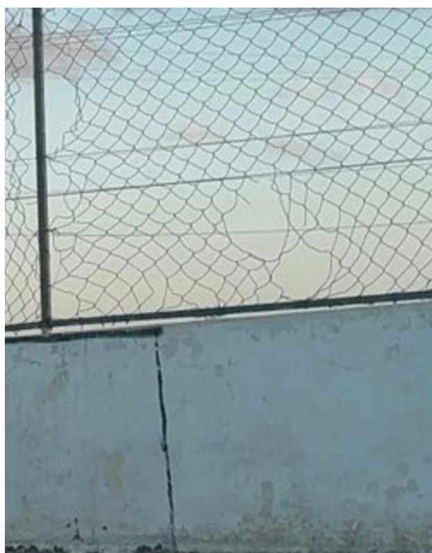
Situação da grade de "proteção".

Sala de sessões da Câmara Municipal de Picuí/PB, 02 de fevereiro de 2026.