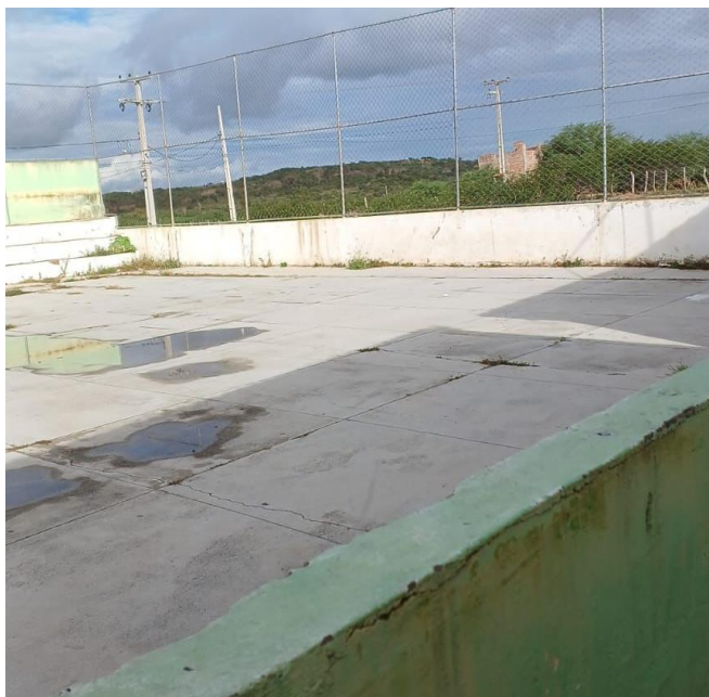
Situação do piso após uma chuva;